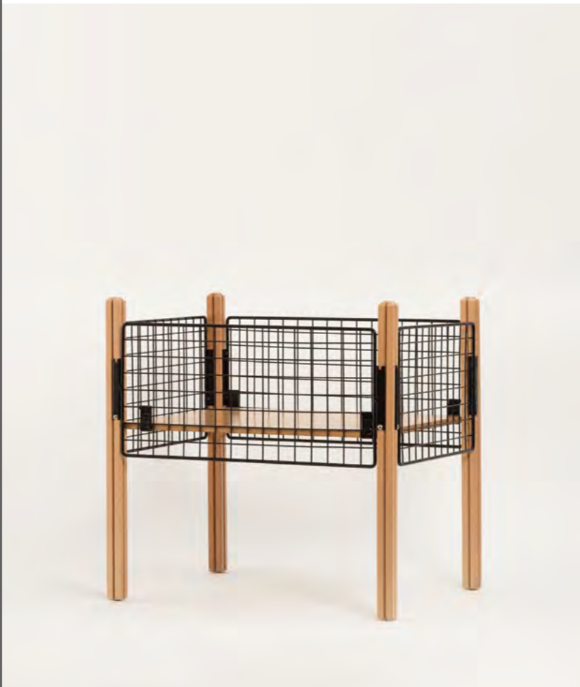
FEBE A GRIGLIA